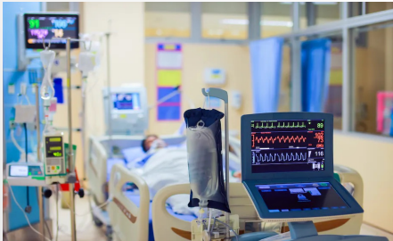
ICU image

Affiche présentée au 8 e Congrès mondial du Secrétariat international des infirmières et des infirmiers de l'espace francophone (SIDIEF) le 19 octobre 2022.