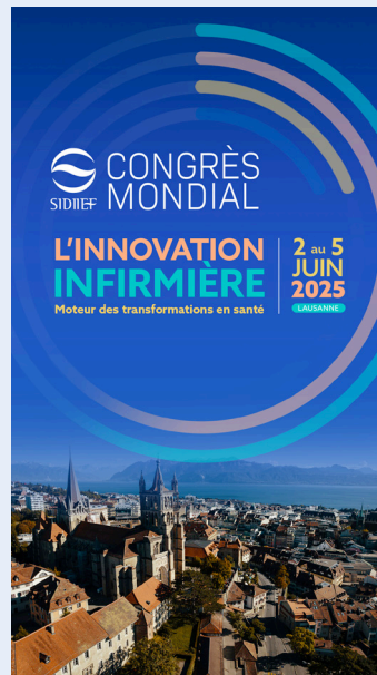
Story (1920 x 1080px)