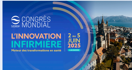
LinkedIn (1200 x 627px)