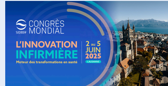
Facebook (1200 x 628px)