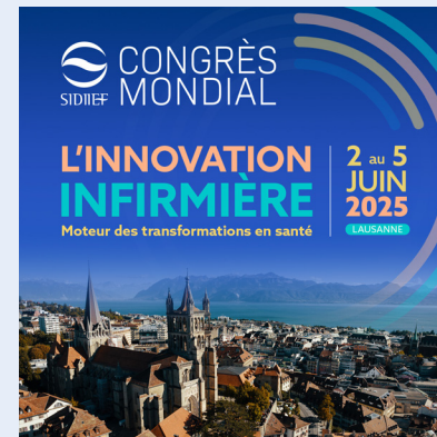
Carré (1200 x 1200px)